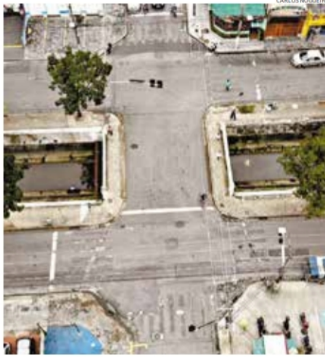
Canal 2 com R. Evaristo da Veiga (Campo Grande): exemplo de desgaste

No ano passado, a CET teve lucro de R$ 23,6 milhões. Parte do resultado positivo é decorrente da receita de R$ 45,3 milhões com multas em 12 meses.