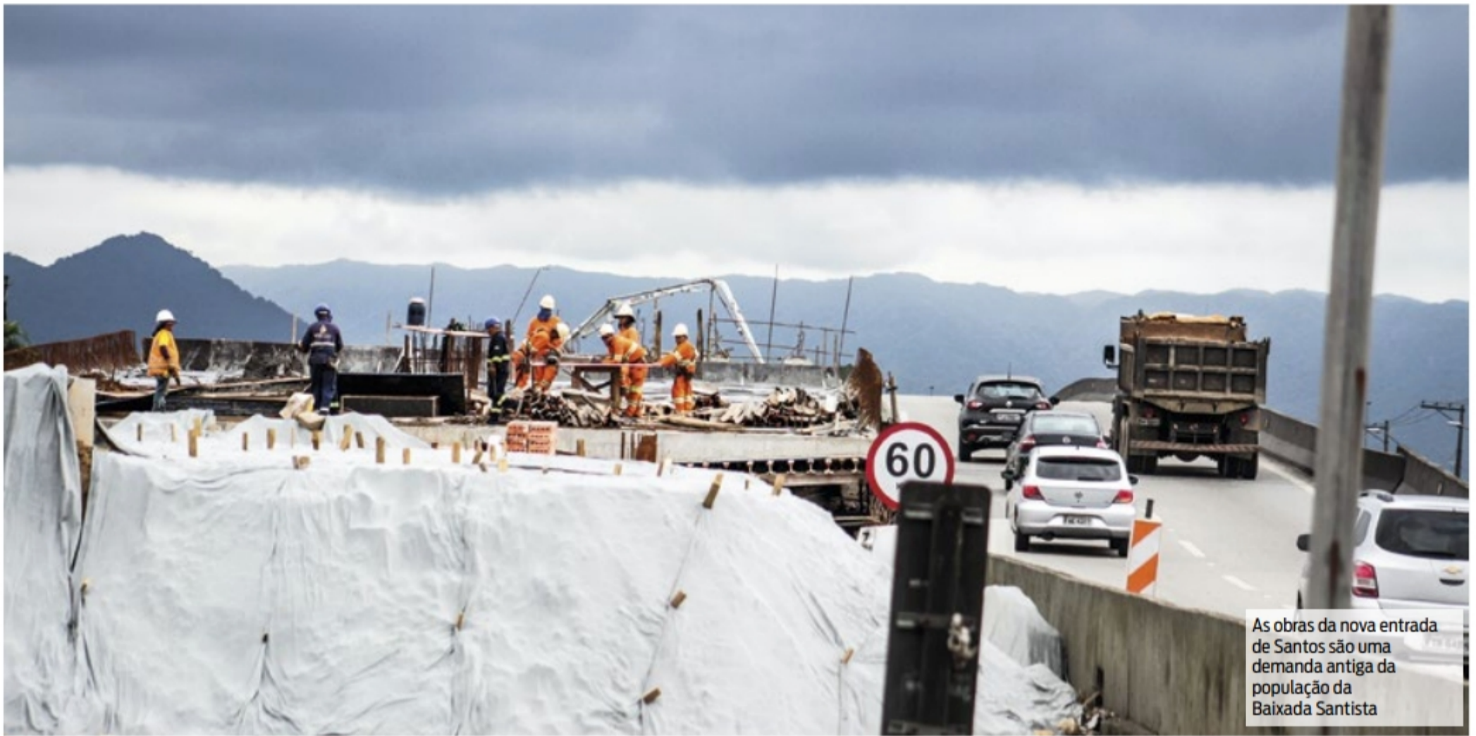
As obras da nova entrada de Santos são uma demanda antiga da população da Baixada Santista