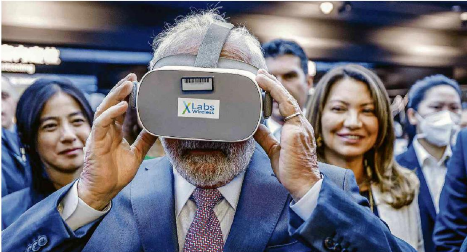
Luiz Inácio Lula da Silva (PT) usa óculos de realidade virtual da Huawei em visita a centro de pesquisa e desenvolvimento da empresa, em Xangai, com a primeira-dama, Janja.