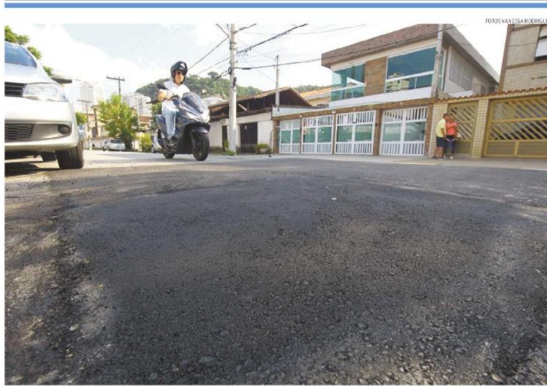
Prefeitura considera que trechos como este, na Rua Benedito Ernesto Guimarães, no Marapé, precisam de reparos e exige providências