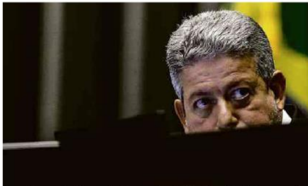
O presidente da Câmara dos Deputados, Arthur Lira (PP-AL), em sessão no plenário

Cartas para al. Barão de Limeira, 425, São Paulo, CEP 01202-900. A Folha se reserva o direito de publicar trechos das mensagens. Informe seu nome completo e endereço