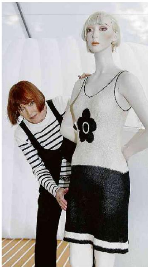
Mary Quant em foto de 2004, em Paris.