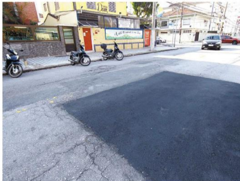
Outro ponto mencionado é a pista da Rua Oswaldo Cochrane, na altura do número 156, no Embaré

O problema do trecho danificado se realça ao se caminhar para defronte à Igreja da Pompeia. "A Sabesp precisa tomar uma atitude. Não sei por que ela não fez, nem quanto tempo que leva para fazer esse tipo de reparo. Como estão querendo privatizar a empresa, espero que isso não aconteça