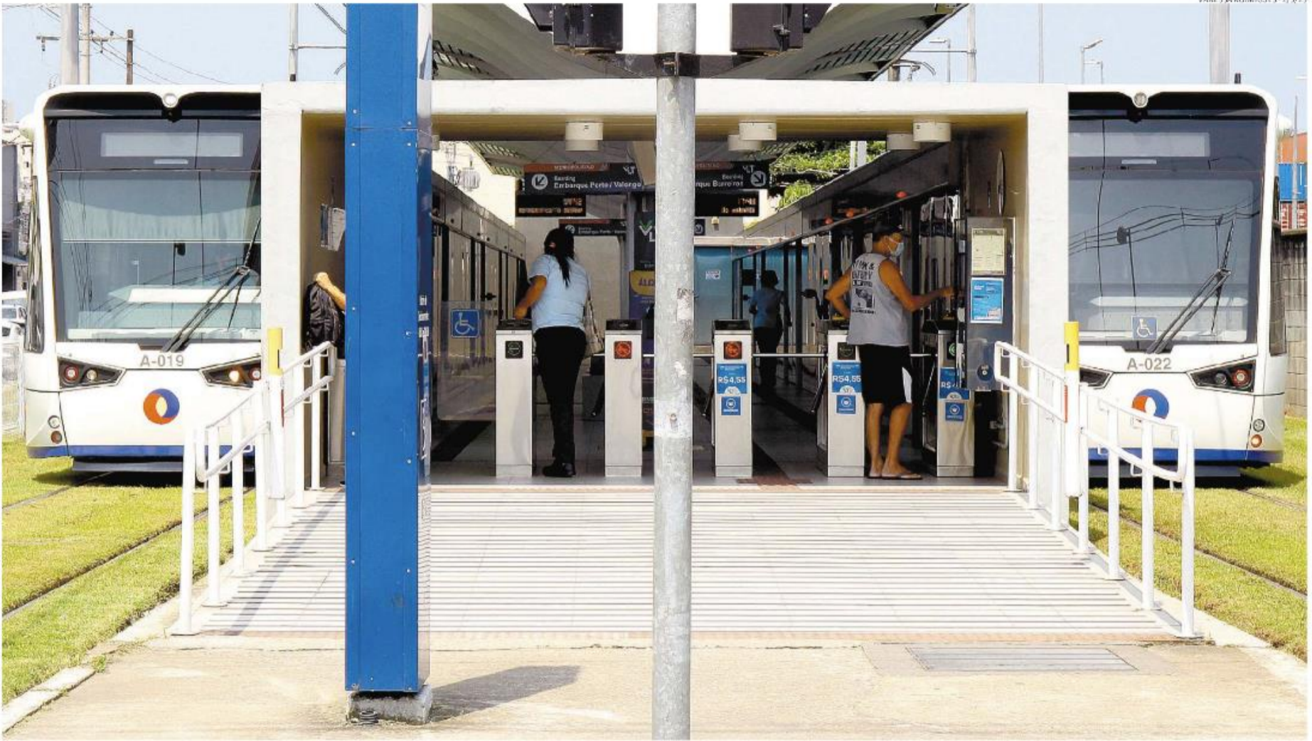
VANESSA RODRIGUES - 2/3/23

Conforme planilha da EMTU, o investimento previsto para este ano nas obras do Sistema Integrado Metropolitano da Baixada Santista é de R$ 193,3 milhões. No primeiro trimestre, aplicaram-se cerca R$ 15,9 milhões