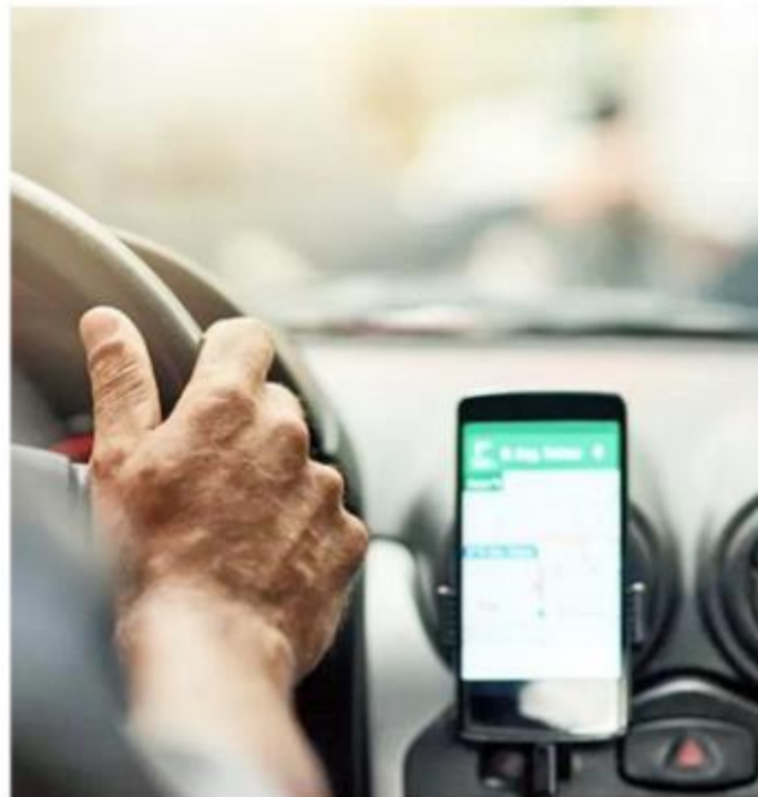
Servidores poderão usar aplicativo no exercício da função

O valor é fixo durante todo o ano vigente de contrato, ou seja, a Administração Municipal não pagará a chamada "tarifa dinâmica" (alteração de preço devido à demanda ou horário de maior utilização).