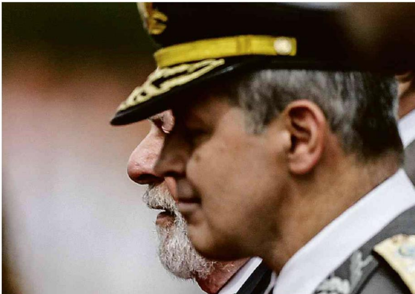
O presidente Luiz Inácio Lula da Silva (PT) participa de ato pelo Dia do Exército ao lado do comandante da Força, general Tomás Paiva.

Ante o episódio, líderes da base governista mudaram de posição e passaram a apoiar a abertura de CPMI para investigar os ataques às sedes dos Poderes. A comissão pode ser instaurada na próxima semana. Política A4 e A6