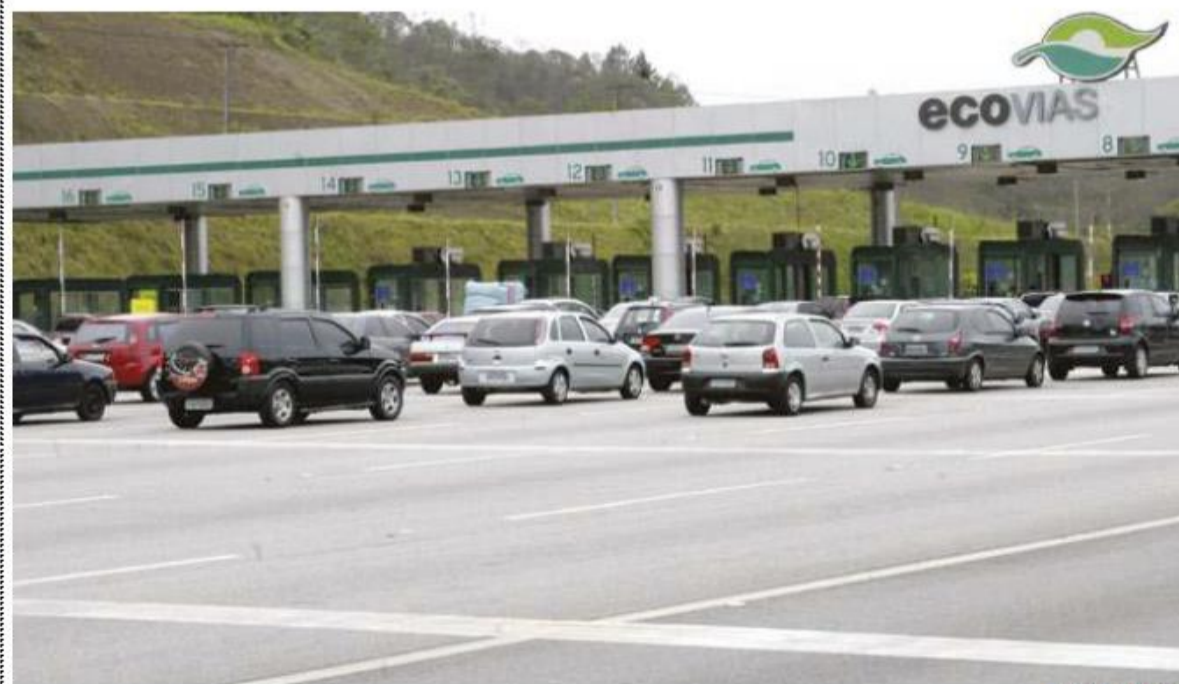
THIAGO NEMO/CADERNOS DE SÃO PAULO