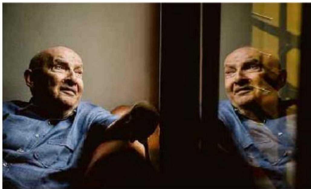
O historiador e professor da USP Boris Fausto, que morreu nesta terça-feira (18), em São Paulo

Cartas para al. Barão de Limeira, 425, São Paulo, CEP 01202-900. A Folha se reserva o direito de publicar trechos das mensagens. Informe seu nome completo e endereço