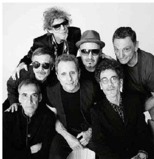
Da esq. à dir.: Arnaldo Antunes, Charles Gavin, Branco Mello, Tony Belotto, Sérgio Britto, Nando Reis e Paulo Miklos.

100 LUGARES INCRÍVEIS NO BRASIL Dez cidades preservadas que ajudam a contar a história brasileira CS