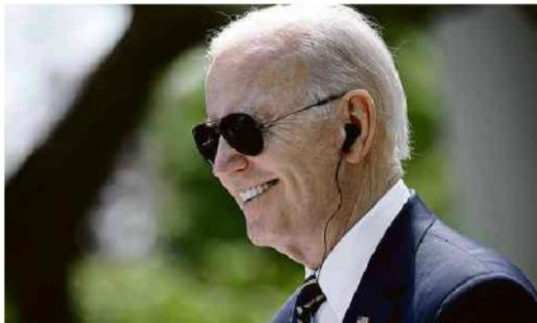
O presidente dos EUA, Joe Biden, durante conferência na Casa Branca com o presidente da Coreia do Sul, Yoon Suk-yeol

Cartas para a L. Barão de Limeira, 425, São Paulo, CEP 01202-900. A Folha se reserva o direito de publicar trechos das mensagens. Informe seu nome completo e endereço