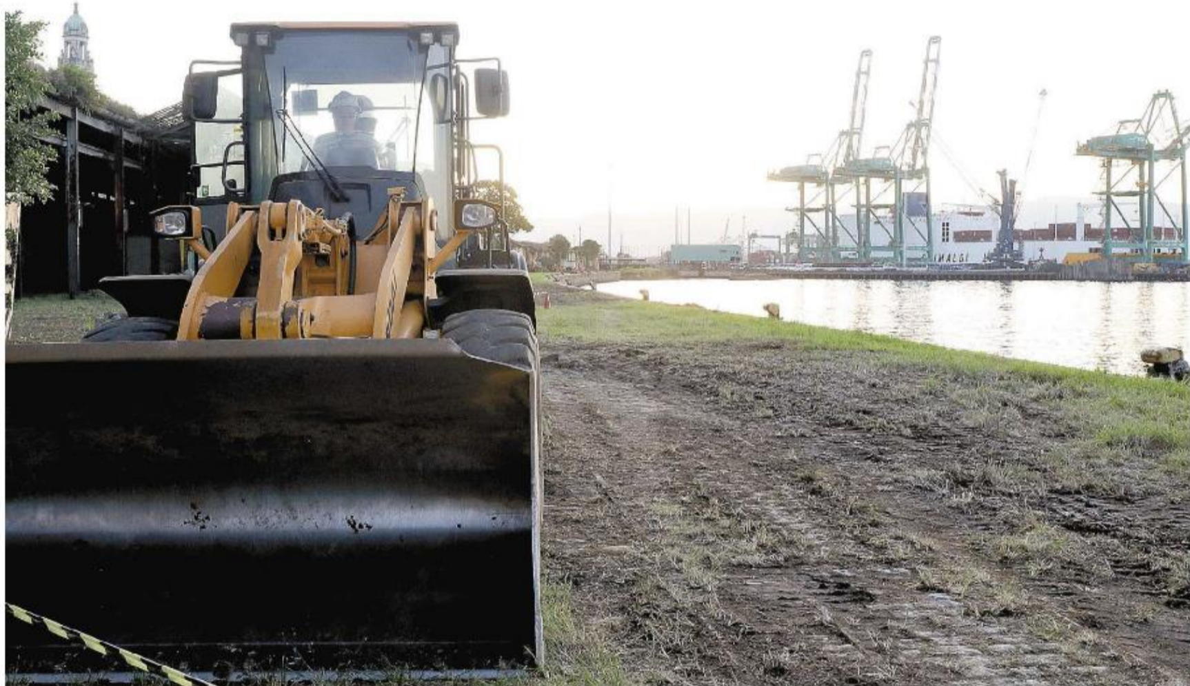
O espaço dos antigos armazéns do Porto de Santos na região do Valongo já conta com retroescavadeiras para a limpeza de toda a área; audiência pública será realizada no dia 31

A primeira audiência, por sinal, está marcada para 31 de maio, às 19h, na Associação de Engenheiros e Arquitetos de Santos, co-