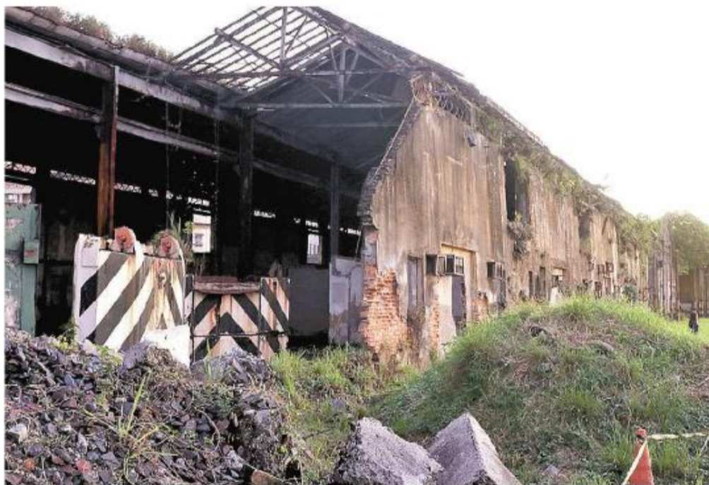
Governo Federal trabalha para que os armazéns 1, 2 e 3 possam abrigar um novo Terminal de Passageiros