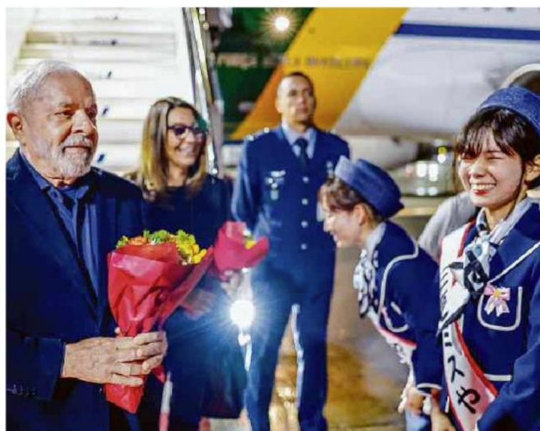
Lula chega com a primeira-dama a Hiroshima, no Japão, para cúpula do G7

Não faz sentido tentar "corrigir" o eleitor, limitando seu poder de fazer más escolhas. A democracia não funciona porque favorece decisões sábias, mas porque reduz a probabilidade de violência política. Para isso, é preciso que todos os grupos tenham oportunidade de disputar pleitos. A Ficha Limpa conspira contra. Opinião A2