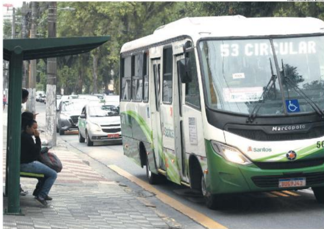
Na sexta-feira, Prefeitura de Santos e Viação Piracicabana assinaram novo contrato, por mais oito anos

O motivo do prazo apontado por Gonçalves é que a circulação teste do VLT - sem cobrança de tarifa - deve acontecer de julho até, no máximo, outubro de 2024. “Até lá tem estar pronto esse trabalho, além