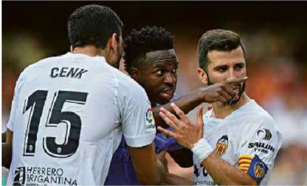
O atacante do Real Madrid Vini Jr. (centro) reage após sofrer ofensas racistas durante partida em Valência, na Espanha 21.mai

Cartas para al. Barão de Limeira, 425, São Paulo, CEP 01202-900. A Folha se reserva o direito de publicar trechos das mensagens. Informe seu nome completo e endereço