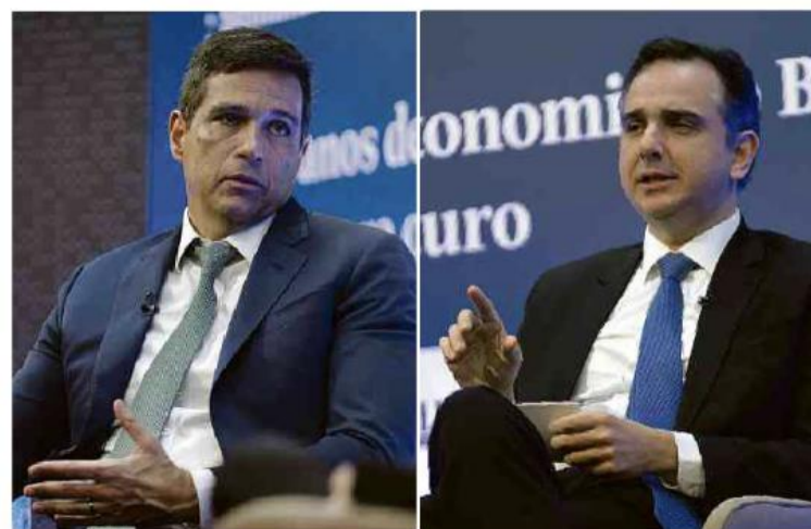
Roberto Campos Neto, do BC, e o senador Rodrigo Pacheco em evento na Folha

O novo pacto pela alfabetização do governo Lula (PT) vai apostar na relação entre estados e municípios e no protagonismo de avaliações, mas não prevê papel central para universidades —algo criticado por especialistas. O Ministério da Educação planeja investir R$ 800 milhões ainda em 2023. Cotidiano B1