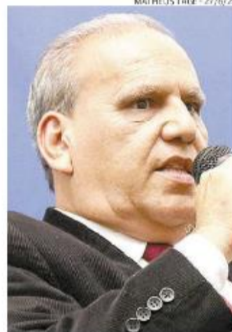
Amaral exporá dados da Baixada

ra também trará dados da Baixada Santista, com o histórico da geração de empregos com carteira assinada, informalidade e alta do número de pessoas que se tornam microempreendedores individuais (MEIs).