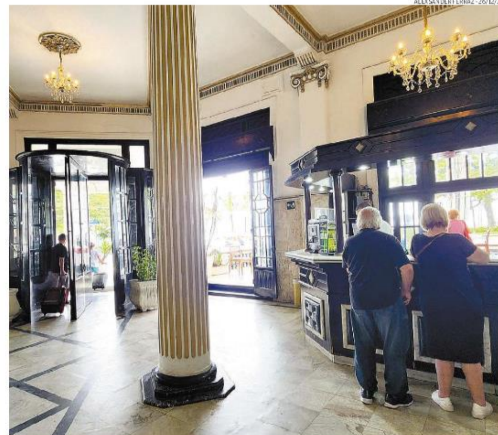
Entre os 161 tipos de empreendimentos e atividades que o Município poderá licenciar, está o de hotéis

A Lei Complementar 1.196, sancionada pelo prefeito Rogério Santos (PSDB) e publicada em 27 de março no Diário Oficial, estabelece normas, critérios, prazos e procedimentos a adotar. Dois meses depois, o licenciamento tem início.