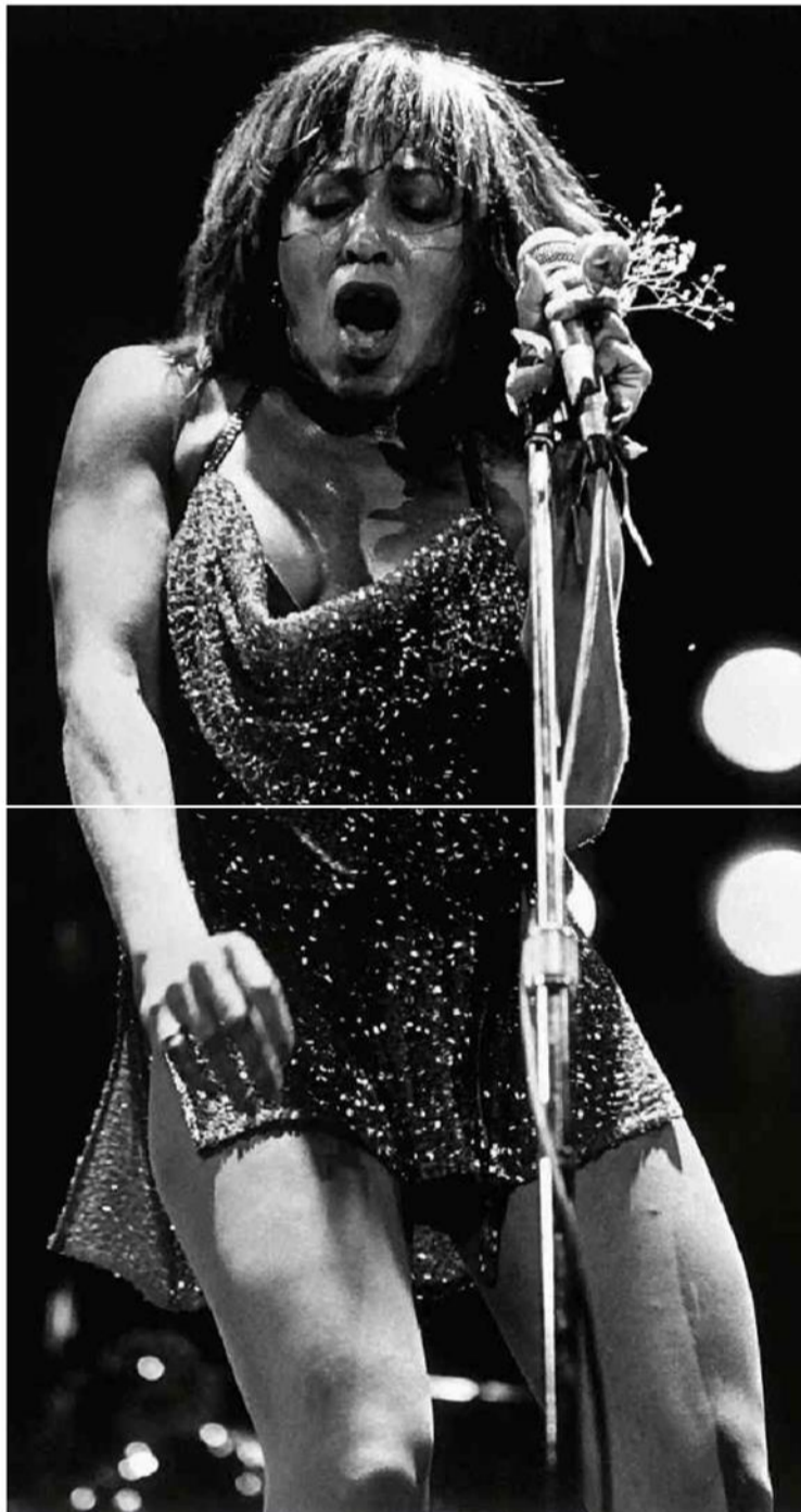
A cantora americana Tina Turner durante show na Holanda, em 1982.