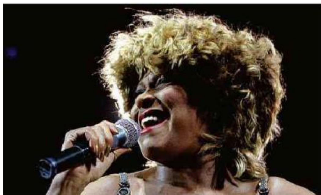
A cantora Tina Turner durante apresentação no palco do Palácio dos Congressos do Kremlin, em Moscou, em 1996 Stringer - 5.nov.96/Reuters

Cartas para aL. Barão de Limeira, 425, São Paulo, CEP 01202-900. A Folha se reserva o direito de publicar trechos das mensagens. Informe seu nome completo e endereço