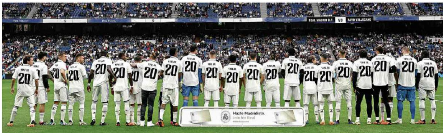
Jogadores do Real Madrid, time de Vinicius Junior, usam camiseta com número e nome do brasileiro na primeira partida após insultos racistas ao atacante, no último domingo (21)

Atleta desbravou caminho sem volta contra o racismo Opinião A2