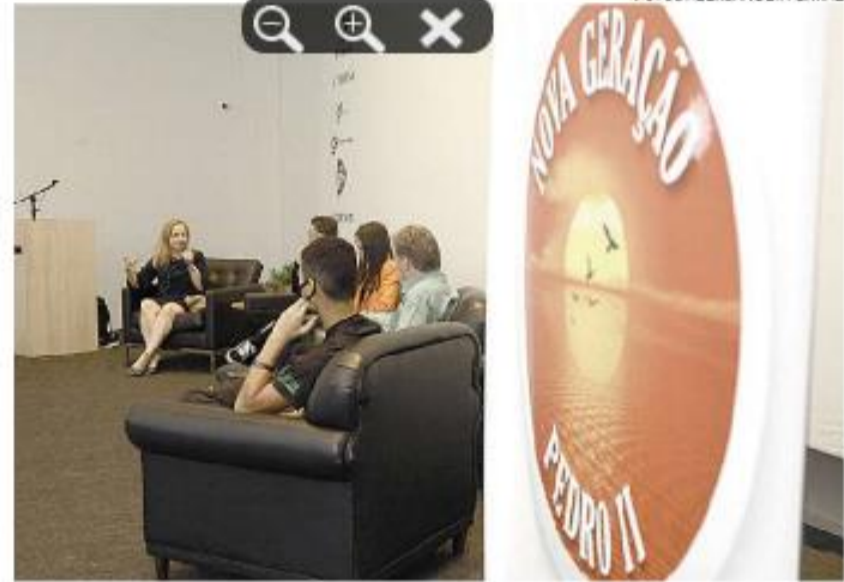
Evento é organizado todos os meses pelos gremistas da UME Pedro II