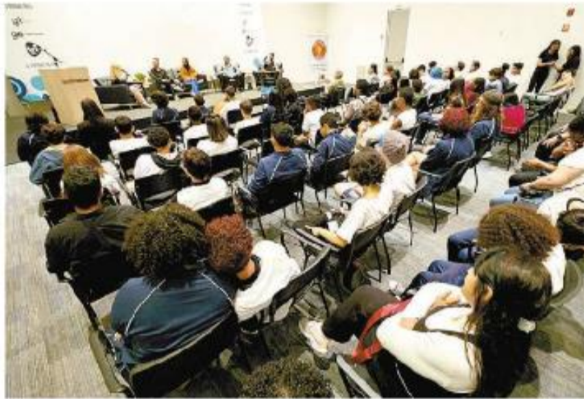
Auditório do Grupo Tribuna, lotado de estudantes de escolas públicas