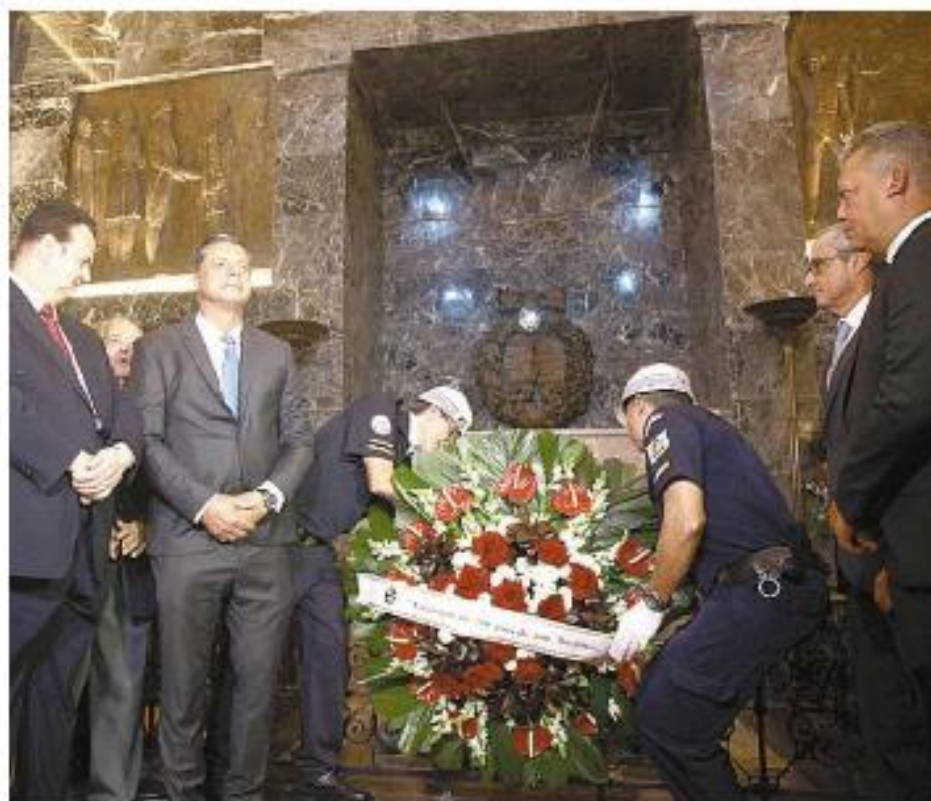
No espaço, ocorreu uma homenagem ao Patriarca da Independência

O restauro foi custeado pela empresa Santos Brasil,