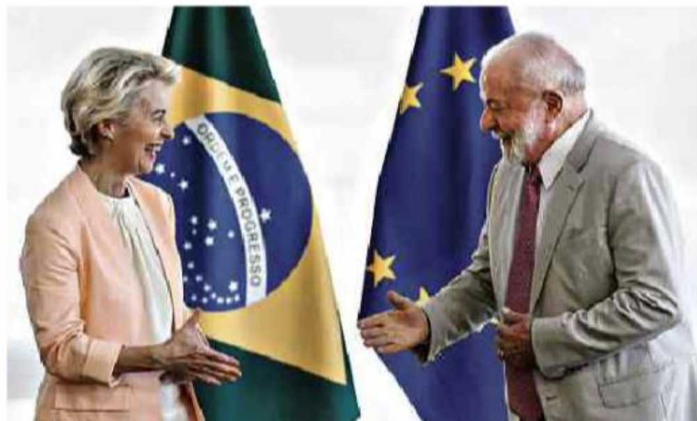
O presidente da República, Lula, e a presidente da Comissão Europeia, Ursula von der Leyen, no Palácio do Planalto

Cartas para al. Barão de Limeira, 425, São Paulo, CEP 01202-900. A Folha se reserva o direito de publicar trechos das mensagens. Informe seu nome completo e endereço