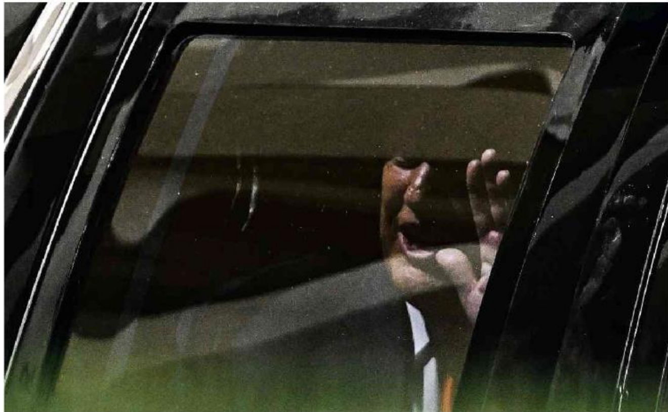
Donald Trump acena dentro de carro após comparecer a tribunal em Miami, onde ficou por cerca de duas horas para ouvir 37 acusações

Lula ao vivo Acerca de estratégia de comunicação do presidente.