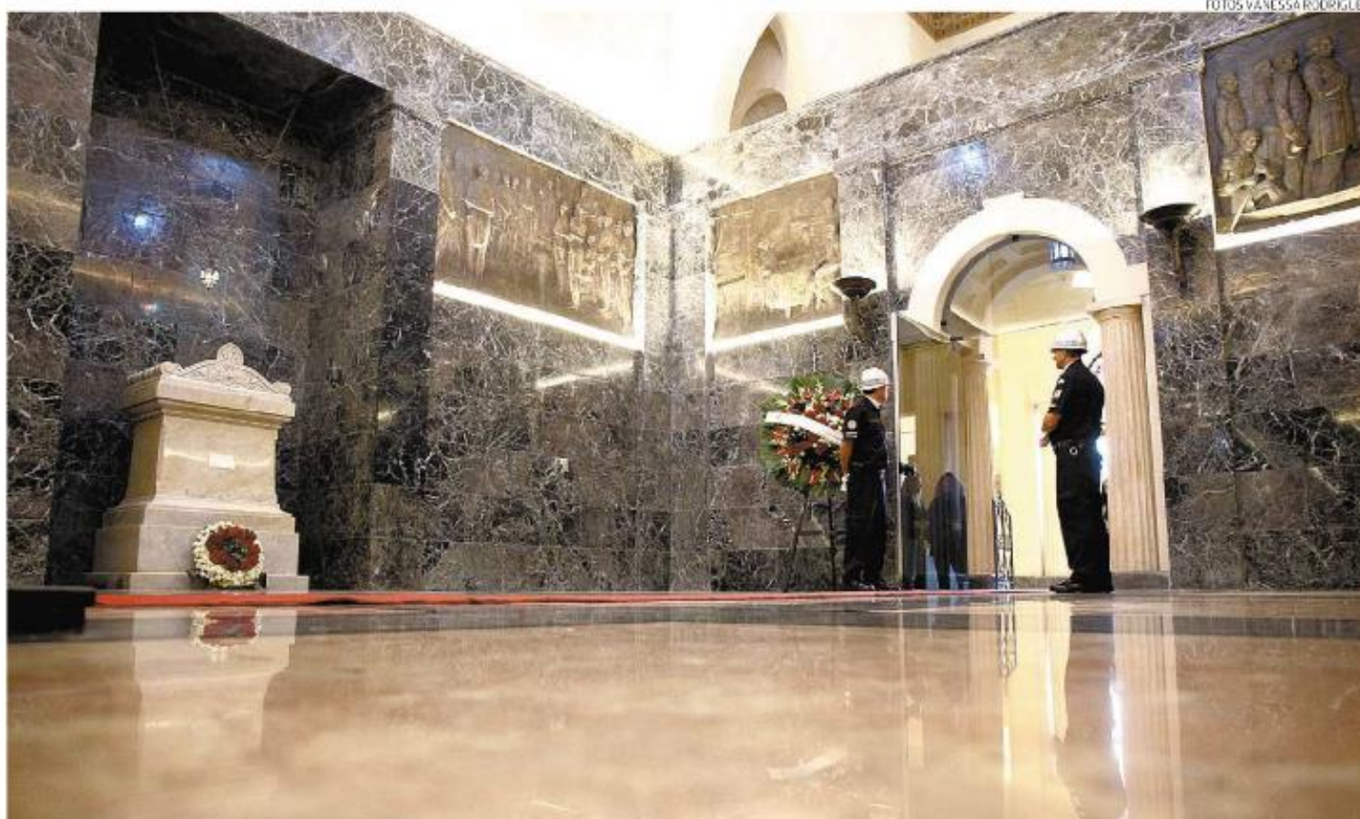
Declarações foram feitas durante a entrega do restauro do Pantheon dos Andradas, onde estão restos mortais do Patriarca e de três irmãos