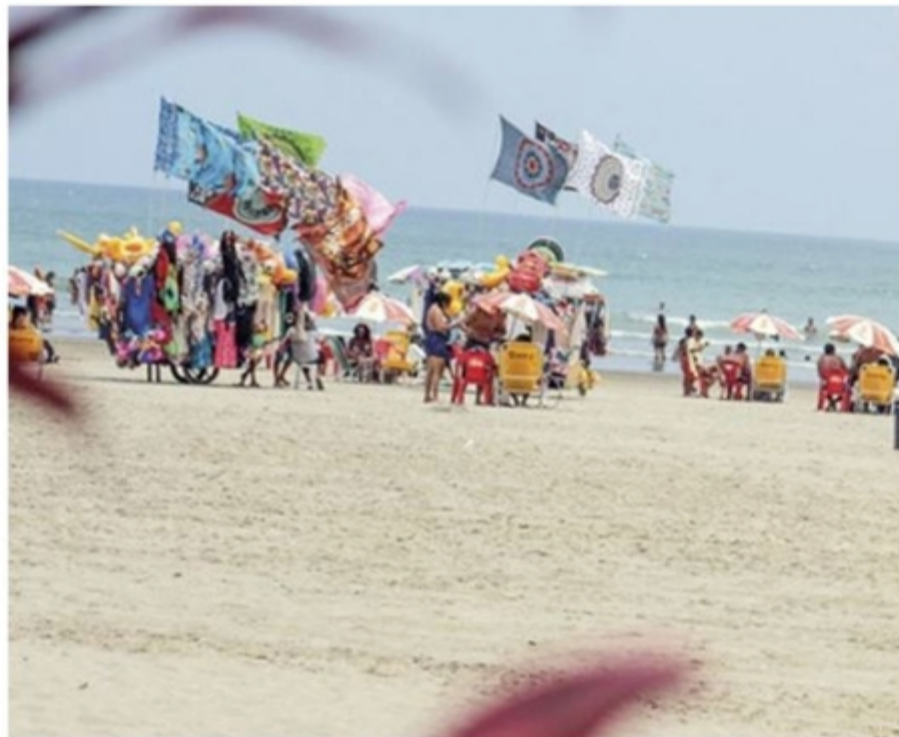
Policiais poderão abordar e revistar ambulantes dentro da Atividade Delegada proposta

Os valores serão baseados na UFESP (R$ 26,53). Oficiais receberão R$ 59,69 por cada hora trabalhada e os praças receberão R$ 57,03 pelo mesmo tempo